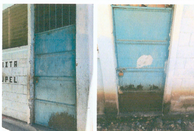
Foto 4: MEJORAMIENTO E INSTALACION DE PUERTAS Y REPARACION DE REPELLO Y CERNIDO DE PAREDES

Observación: Si es necesario se pueden agregar hojas adicionales y actualizar el número de hojas.