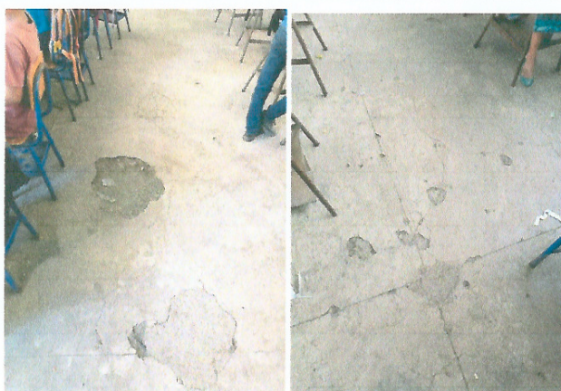
Foto 3: MEJORAMIENTO DE PISO E INSTALACION TIPO CERAMICO O GRANITO