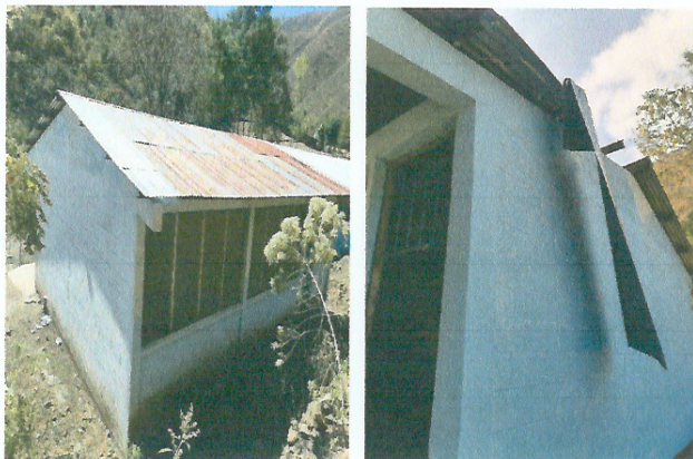
Foto 1: MEJORAMIENTO DE TECHO A LAMINA TROQUELADA CALIBRE 26 Y MANTENIMIENTO DE ESTRUCTURA PORTANTE